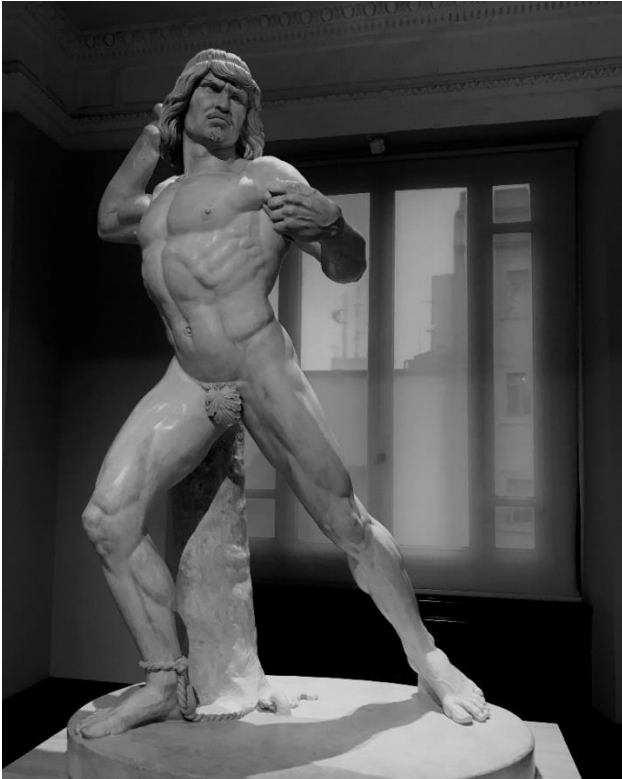
Fig. 1 - Tlahuicole, general tlaxcalteca. En acto de combatir en el sacrificio gladiatorio , de Manuel Vilar.

sacrificio gladiatorio , del propio Vilar (Fig. 1), y los relieves de Hércules , de Felipe Sojo (1833-1869) (Fig. 2), y de Sansón bebiendo agua de la quijada de un asno , de Felipe Valero (activo entre 1842 y 1867), ambos discípulos de Vilar. Temática grecolatina aborda también Hipólito Salazar (ca. 1820-22), con la escultura Mercurio adormeciendo a Argos .