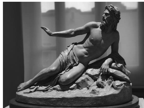
Figura 5. El Río Bravo , de Gabriel Guerra.