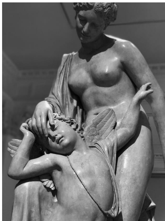
Fig. 3 - Una burla al amor [ Venus y Cupido ], de Gabriel Guerra.