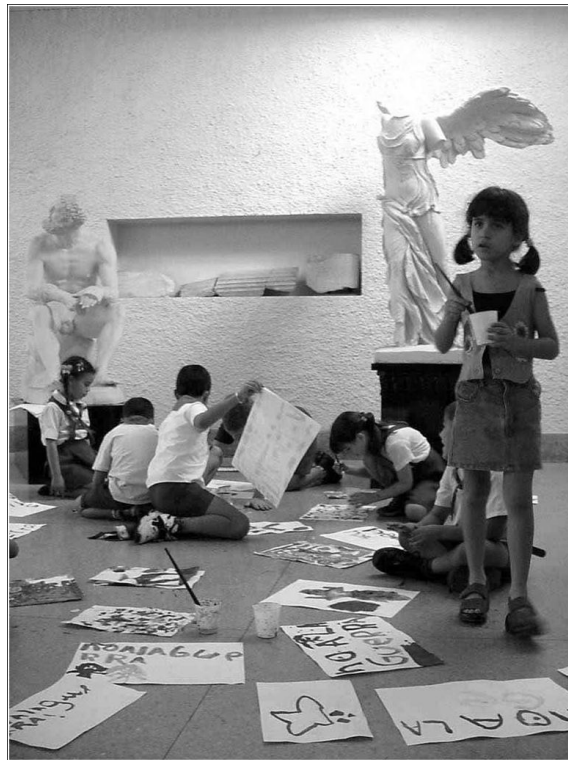
Fig. 8 - Niños pintan en el local actual del museo, ubicado en la segunda planta de la Facultad de Artes y Letras, en el edificio Dihigo.

auspiciaba conferencias, recitales, la muestra de la llamada Pieza del Mes, pero también coloquios y labores de extensión cultural, como talleres con niños (Figura 8) y la publicación de libros.