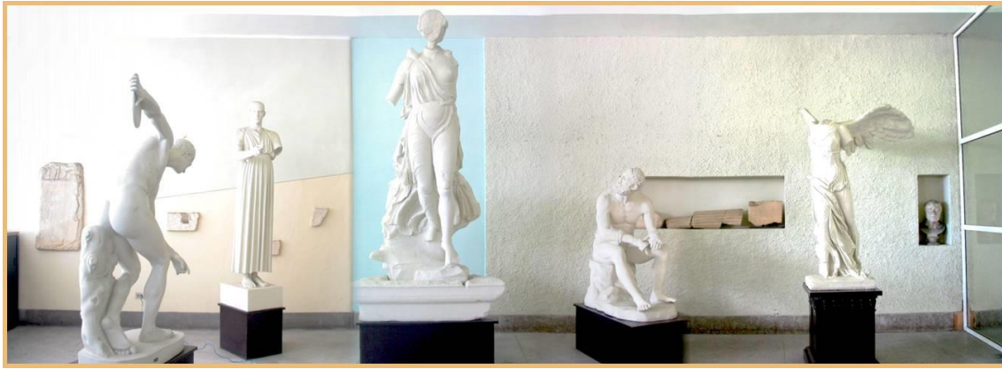
Fig. 6 - Otra vista del museo en su actual local.