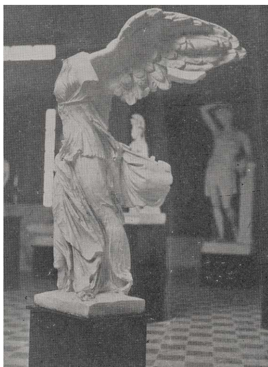
Fig. 4 - Reproducción de la Nike en el antiguo museo.