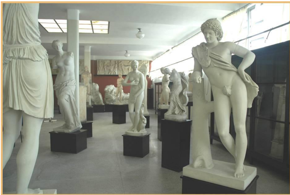
Fig. 5 - Vista del museo en su actual local, ubicado en la Facultad de Artes y Letras, Edificio Dihigo, Zapata y G, El Vedado.

En los años cuarenta el Dr. Dihigo mantuvo sus actividades no solo de investigación sino también de extensión cultural y cooperó en la fundación de Teatro Universitario, que se dio a conocer en 1941 con una traducción suya de la Antígona de Sófocles. Pero sobre todo se esforzó por conseguir que se fundara un instituto de idiomas y que la facultad pudiera contar con un edificio propio, en el cual se dispondría de una sala especialmente habilitada como sede del museo. Finalmente, poco antes de su muerte, Dihigo coloca la primera piedra del nuevo edificio emplazado en Zapata y G, el cual se termina en 1952 y también toma nombre de su principal promotor. Desde entonces el museo ocupa un espacio diseñado especialmente para él, en la segunda planta del mencionado inmueble (Figuras 5 y 6).