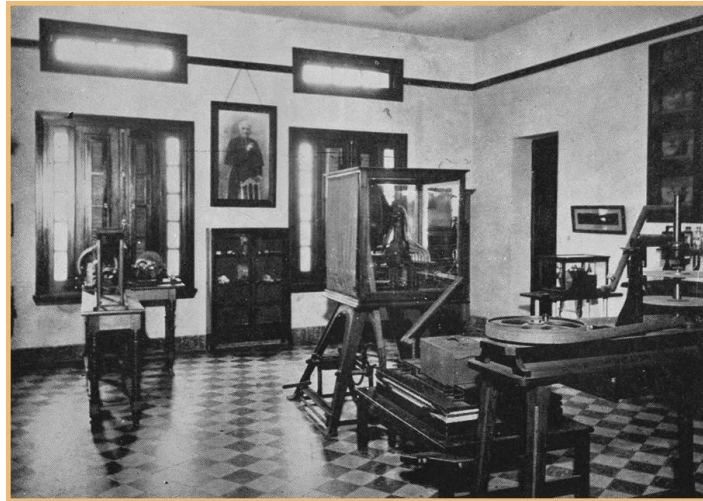
Fig. 2 - Laboratorio de Fonética Experimental instalado por Dihigo.