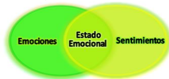
Figura 1. Relación estado emocional.

impacto afectivo que se presenta de forma difusa e inestable. Son asociadas con las emociones secundarias que son aquellas aprendidas y culturalmente condicionadas, donde el sujeto es consciente. Existe una relación directa entre los sentimientos y las emociones (ver Figura 1), lo que conlleva al estado emocional y dependerá de esta relación para cambiar de positivo a negativo y viceversa.