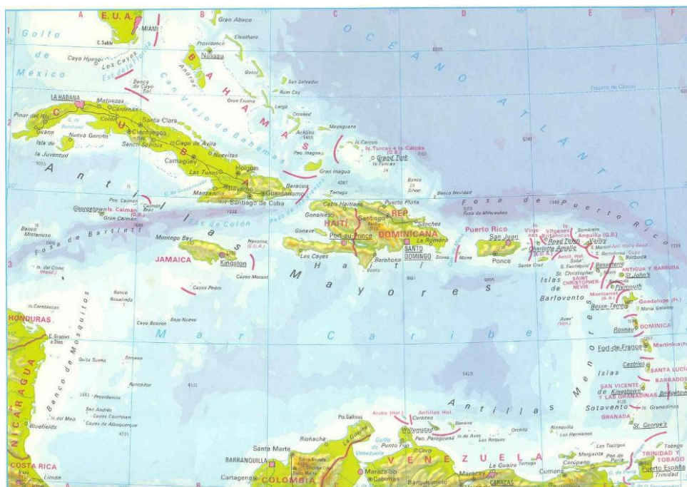
Figura 1. Posición geográfica de Cuba en el Caribe.

que, desde la etapa colonial española, se le conozca con el sobrenombre de la Llave del Golfo . La significativa importancia geopolítica que ha tenido el país a través de su desarrollo se ha manifestado con mayor trascendencia durante los últimos 60 años, con respecto a América Latina, por sus históricas y contradictorias relaciones con su cercano y poderoso vecino del Norte: Estados Unidos de Norteamérica; a la vez, esto ha propiciado, de alguna manera, el interés de los ciudadanos estadounidenses por visitarla.