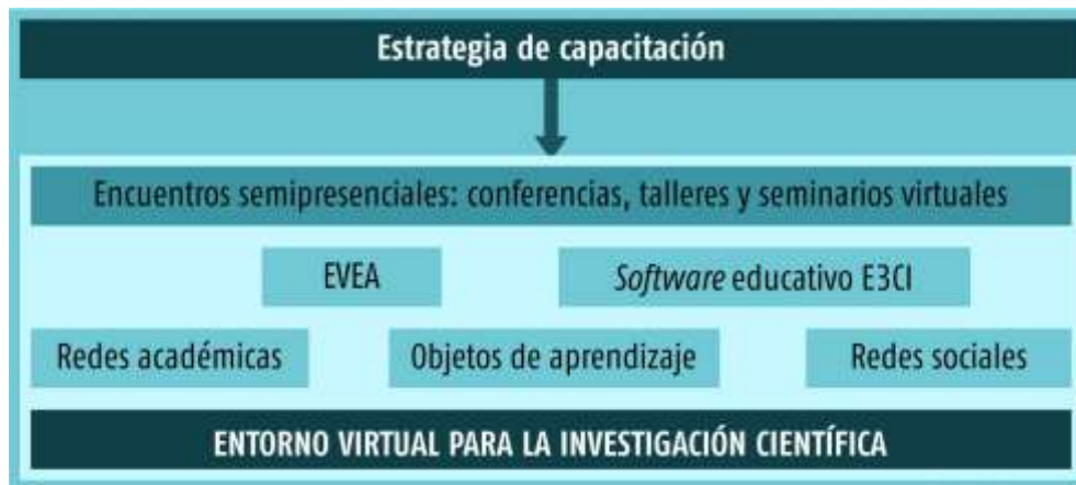
Figura 1. Sistema de recursos educativos digitales empleados.

La estrategia estuvo sustentada mediante el empleo de un entorno virtual, el cual comprendió: